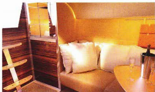
↑ Fidèle à son habitude, Philippe Starck mise sur le orange pour le cuir des parois ou les pochettes de chez Goyard.