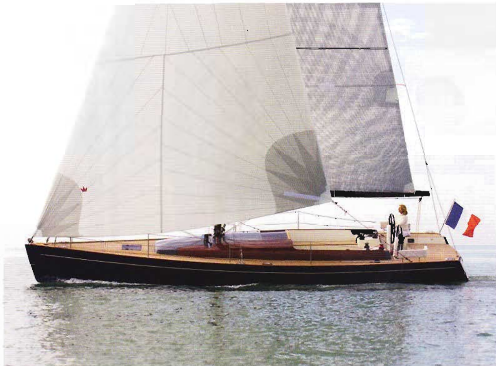
↑ Le Tofinou 12 standard déjà recouvert de tek et de vernis devient encore plus chic avec sa cabine signée Starck.

→ Pour styliser leurs embarcations, plusieurs chantiers navals ont recours au service de designers ou de skippers émérites. Starck à babord! Par Alexandre Lazerges