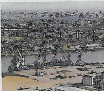
Armel Tripon est déçu, il espérait