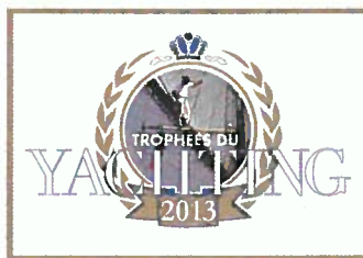
Les Trophées du Yacht et du Yachtman de l'année