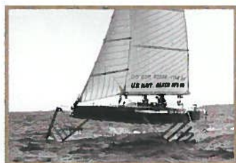
Dossier Les pionniers des bateaux volants