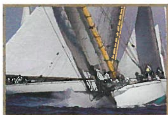
Régates Royales Du vent dans les voiles