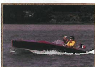
Essai Delage Le joujou extra