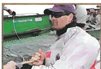
Exclusif Américain's Cup Coutts se confie à YC