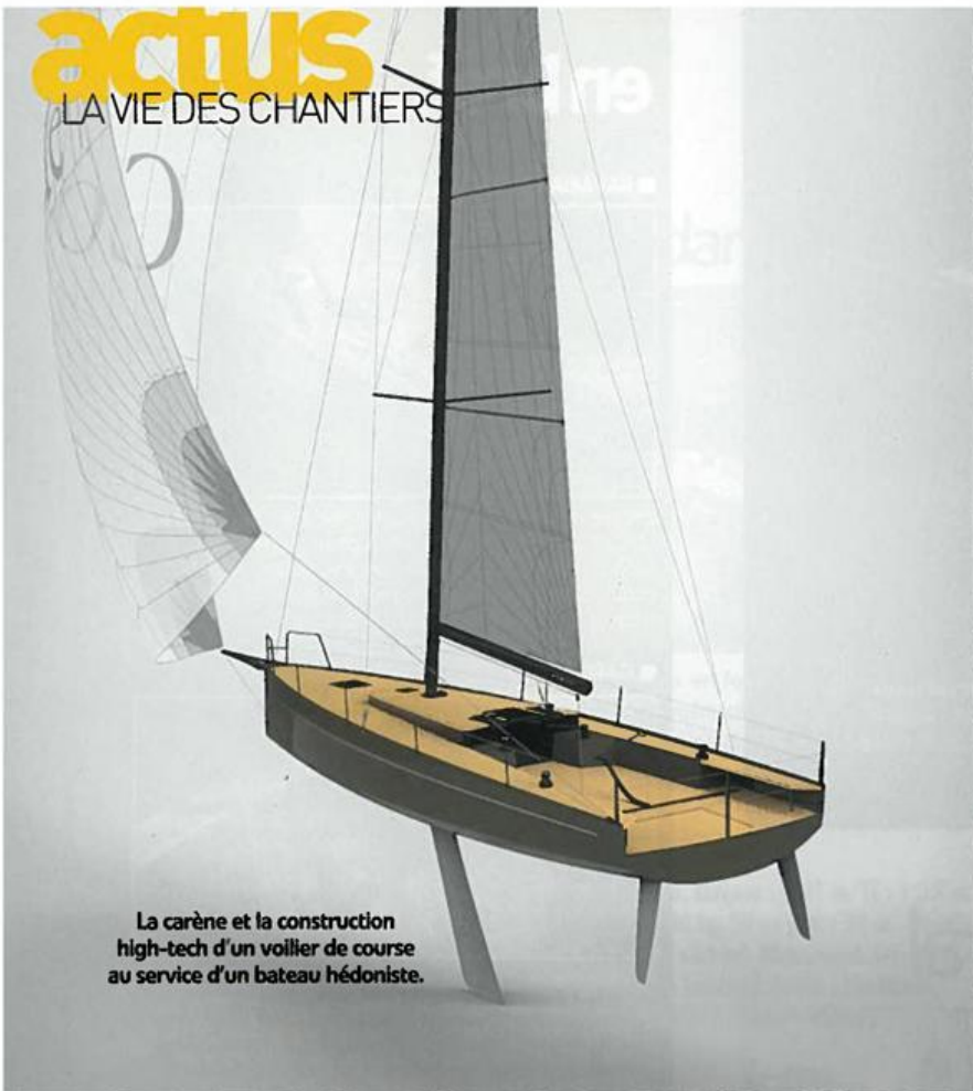
La carène et la construction high-tech d'un voilier de course au service d'un bateau hédoniste.